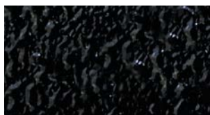
GRAVINEL покрытие полиуретановое структурное 430, черный, HVLP 1,7 мм