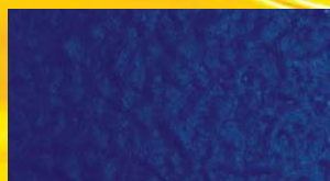
GRAVINEL покрытие полиуретановое структурное 430, МИКС RAL 5017 и GRAVINEL паста 23, HVLP 1,7 мм

Срок хранения в оригинальной упаковке: 2 года