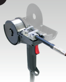
Горелка Spool Gun