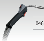
Горелка Push-Pull (24B)