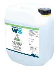
ref. 062511 специальная сварочная охлаждающая жидкость - 5 л