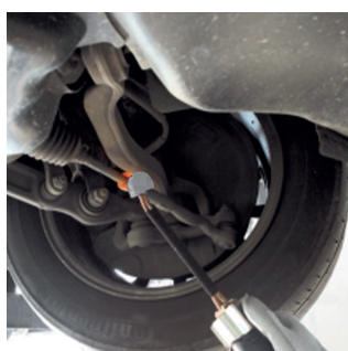
Раскрепления продольной рулевой тяги.