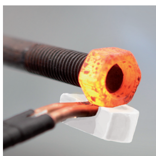
Устранение заедания болтов