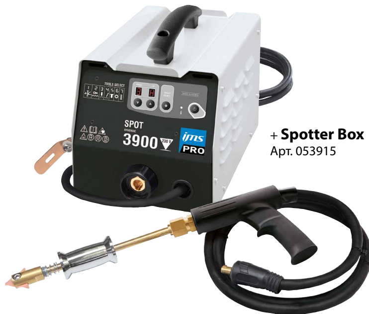
+ Spotter Box Арт. 053915

Сварная точка совершается автоматически простым контактом между инструментом и деталью, которую нужно выправить.